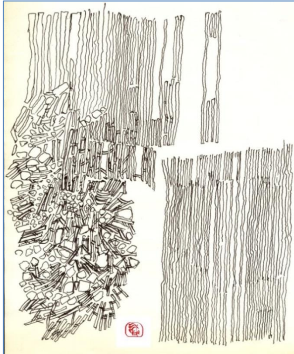
A. Mazzotta. Frammenti