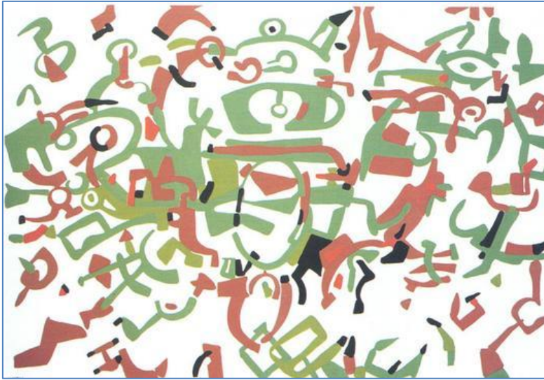
Carla Accardi. Frammenti (1954)

Tuttavia, nella pratica abituale, quando si tratta di enti della geometria elementare, si usano ordinariamente dei disegni, che ci richiamano le immagini da cui i concetti sono stati formati. A questo proposito ricordiamo ancora una volta che non le immagini, e meno ancora i disegni, sono in grado di fondare una deduzione valida, ma soltanto i concetti rigorosamente definiti. Ci si potrebbe quindi